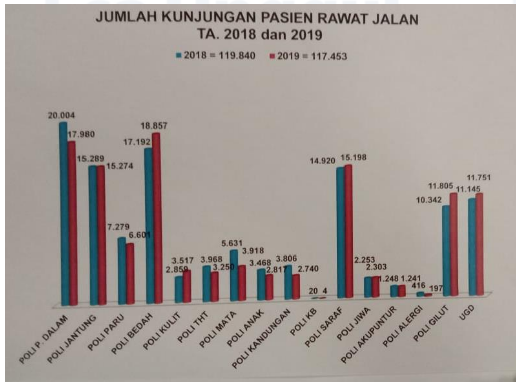
Gambar Jumlah Kunjungan Pasien Rawat Jalan TA. 2018 dan 2019